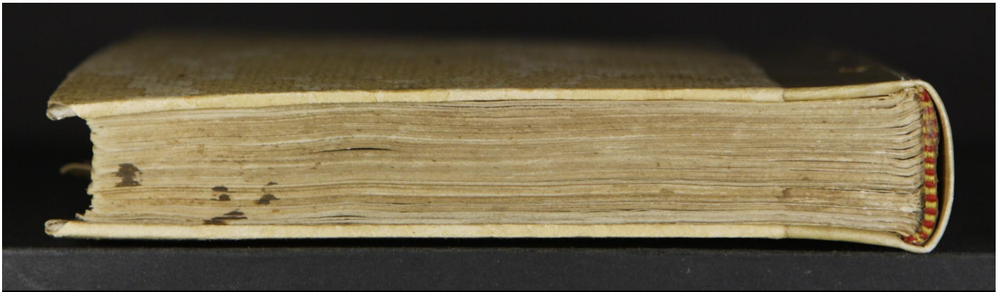
Magl. A.5.64